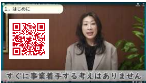
区長メッセージの全文は上記QRコードから確認できます