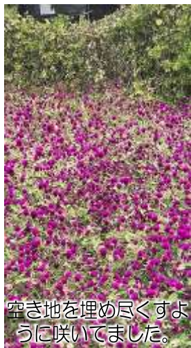
空き地を埋め尽くすように咲いてました。