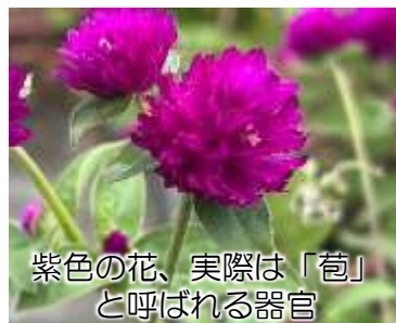
紫色の花、実際は「苞」と呼ばれる器官

今年の10月旬に堀ノ内2丁目に出会った「センニチコウ」です。空き地いっぱいには紫色の花を咲かせていました。もともとパナマやグアテマラなど中央アメリカ原産の植物で、日本では園芸用に育てられる一年草です。