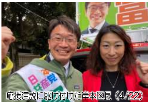
応援演説に駆け付けた岸本区長（4/22）