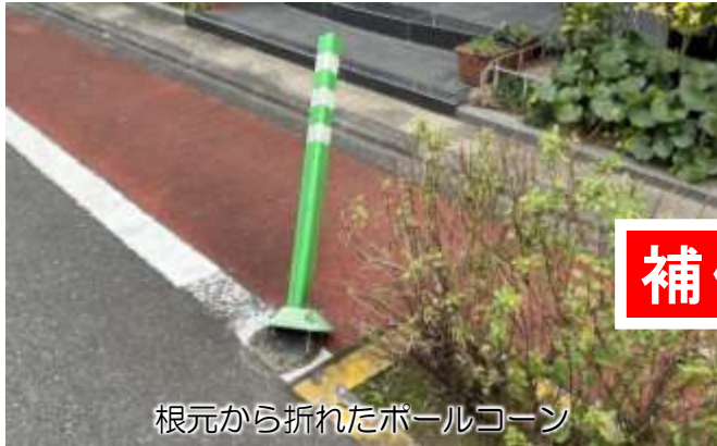
根元から折れたポールコーン