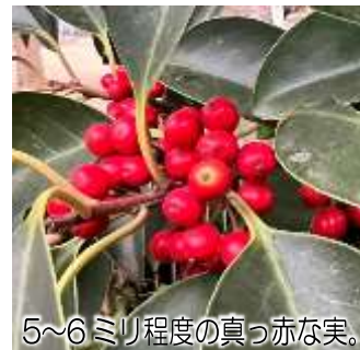
5～6ミリ程度の真っ赤な実。

など広い範囲に分布する常緑樹で、10メートル程度に成長します。漢字では「黒鉄藜(くろがねモチ)」と表記されます。名前の由来は、若い枝が紫色に近い褐色になることから黒鉄の名が付いたとの説や、落ち葉が鉄の錆(さび)色に似ているからなど、諸説あるようです。