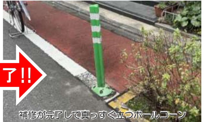
補修が完了して真っすぐ立つポールコーン