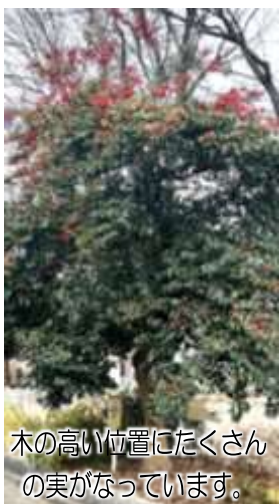
木の高い位置にたくさんの実がなっています。

春に白い小さな花をつけ、11月から2月にかけて結実します。雌雄異株で雌株だけに実がなります。樹皮からは「鳥糞(トリモチ)」が取れ、鳥や昆虫を捕獲するのに古くから利用されてきました。現在では禁止猟具に指定され、トリモチを使って野鳥を捕まえることは法律違反になります。