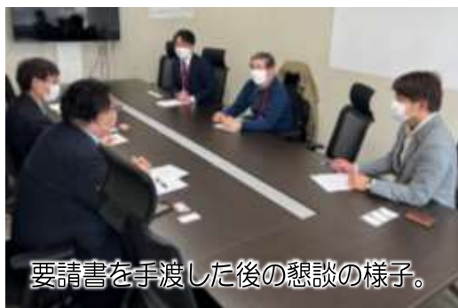
要望書を手渡した後の懇談の様子。

対応した東京メトロ・サステナビリティ課からは「住民の声を弊社にお持ちいただきお礼申し上げます」「用地の用途は立っていないが、（近隣地権者と）粘り強く交渉をしていきたい。」との話がありました。