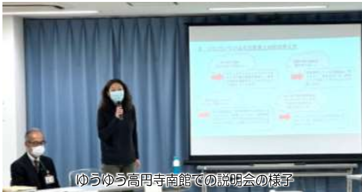
ゆうゆう高円寺南館での説明会の様子