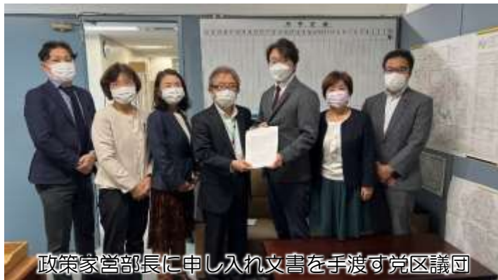
政策家営部長に申し入れ文書を手渡す区議団