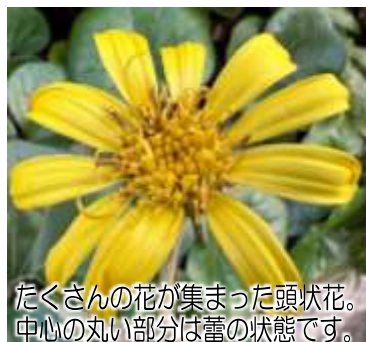
たくさんの花が集まった頭状花。中心の丸い部分は蕾の状態です。

高円寺南の桃園川緑道で出会った「ツワブキ」です。1月中旬の寒空のもと、青々とした光沢のある葉の間から、蕾をいくつも伸ばし、その先端では黄色い花が咲き始めていました。