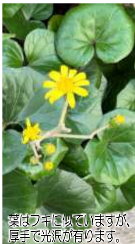
葉はフキに似ていますが、厚手で光沢があります。

地中に短い茎が埋まっていて、地上に出ているのは葉柄（ようへい）と呼ばれる葉っぱの軸の部分。この部分が食用にされますが、毒性のあるピロリジンアルカロイドが含まれるため、しっかりと灰汁抜きが必要で、区内で見つけても生食はしないでください。