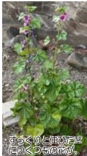
すっきりと伸びた茎にいくつもの花が。