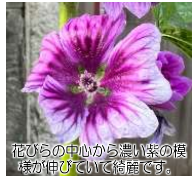
花びらの中心から濃い紫の模様が伸びていて綺麗です。

の向かいの家のおじさんがゼニアオイだと教えてくれました。数年前に植えられたそうですが、毎年綺麗な花を咲かせてくれると嬉しそうに話していました。