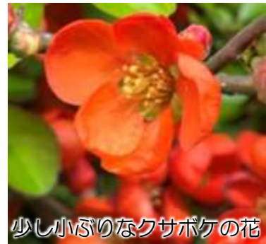
少し小ぶりなクサボケの花

ボケの木は中国原産ですが、本種は日本原産の野生種で関東地方の西側から四国、九州などに分布します。樹高が低く山野の斜面などを這うように枝を伸ばすことからクサボケと呼ばれるようになったとのこと。