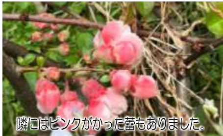
隣にはピンクがかかった蕾もありました。

名前「クサ」が付いていても草ではなく、「梅」と付いていても梅ではなく、動物の名付け方は面白いですね。