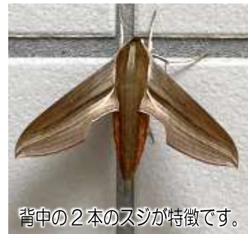
背中2本のスジが特徴です。

擬態しているんでしょうね。胴と翅に流れるような筋が入っている本種の模様は、いったい何に擬態しているんでしょうね。 蛾は姿かたちも多様性に富んでいて、翅の形や模様が落ち葉と見分けがつかないものから、鳥が嫌う大きな目玉模様があるものまで。 の仲間で、蛾は蝶の20～30倍の種類がいると言われております。 蝶は姿かたちも多様性に富んでいて、翅の形や模様が落ち葉と見分けがつかないものから、鳥が嫌う大きな目玉模様があるものまで。