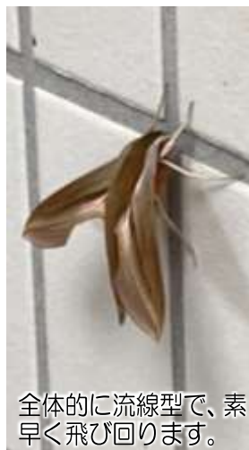
全体的に流線型で、素早く飛び回ります。

擬態しているんでしょうね。胴と翅に流れるような筋が入っている本種の模様は、いったい何に擬態しているんでしょうね。 蛾は姿かたちも多様性に富んでいて、翅の形や模様が落ち葉と見分けがつかないものから、鳥が嫌う大きな目玉模様があるものまで。 の仲間で、蛾は蝶の20～30倍の種類がいると言われております。 蝶は姿かたちも多様性に富んでいて、翅の形や模様が落ち葉と見分けがつかないものから、鳥が嫌う大きな目玉模様があるものまで。