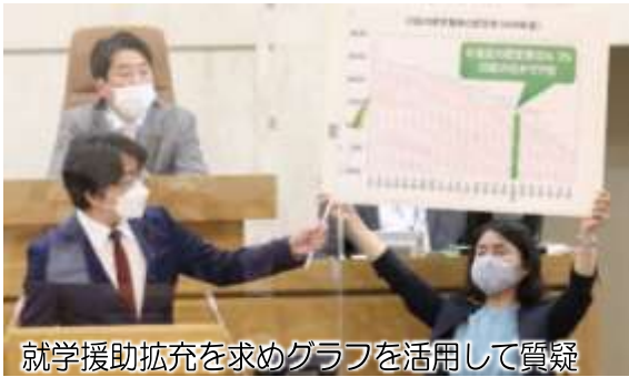
就学援助拡充を求めグラフを活用して質疑