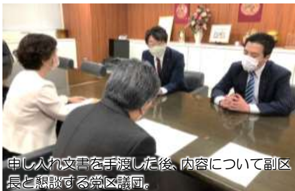
申し入れ文書を手渡した後、内容について副区長と懇談する区議団。

3月31日、日本共産党杉並区議団は杉並区に対し、新型コロナウイルス感染症対策に関する緊急申し入れ(第7次)と生理用品の無料提供を求める申し入れを行ないました。