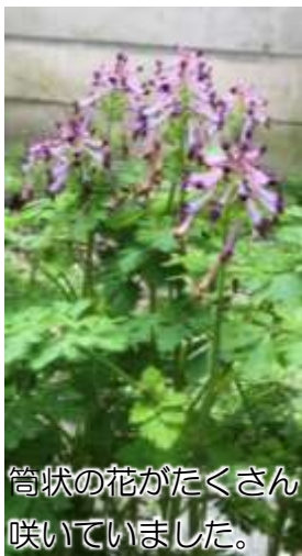
筒状の花がたくさん咲いていました。

この時期は桜や木蓮など樹木に咲く花もいろいろありますが、多くの草花も芽吹き、花を咲かせています。ぜひ足元にも目を向けてみてください。