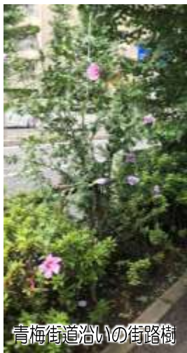
青梅街道沿いの街路樹

中国が原産と言われており、日本では平安時代には栽培されていたようです。大きめの花が人気で世界各国でも様々な園芸品種がつくられ、花弁が5枚の一重咲きの他に、花弁が多い八重咲き品種も作られています。 早朝に開花し夕方にはしぼんでしまう一日花で、その儚さから茶道では一期一会の精神を表現する夏の茶花として扱われています。また、ことわざの「槿花一日の栄(きんかいちじつのえい)」も一日で花が散ってしまうことをたとえたもの。ただし、一部の花は二日以上咲いているものもあるそうです。