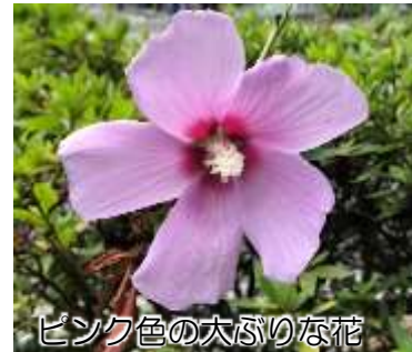
ピンク色の大ぶりの花

中国が原産と言われており、日本では平安時代には栽培されていたようです。大きめの花が人気で世界各国でも様々な園芸品種がつくられ、花弁が5枚の一重咲きの他に、花弁が多い八重咲き品種も作られています。 早朝に開花し夕方にはしぼんでしまう一日花で、その儚さから茶道では一期一会の精神を表現する夏の茶花として扱われています。また、ことわざの「槿花一日の栄(きんかいちじつのえい)」も一日で花が散ってしまうことをたとえたもの。ただし、一部の花は二日以上咲いているものもあるそうです。