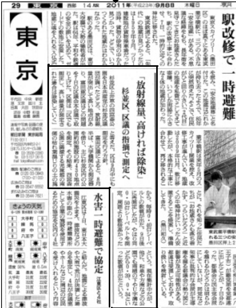
↑ 一般質問が掲載された朝日新聞（使用許可をいただいています。）