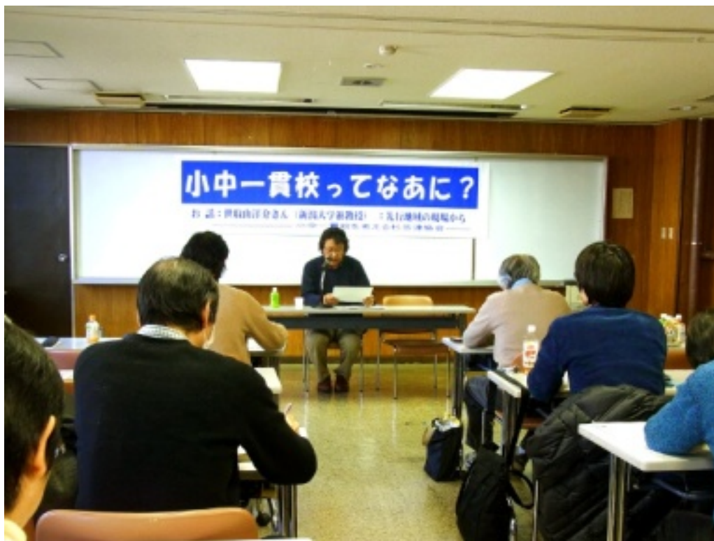
↑ 阿佐ヶ谷地区区民センター4・5会議室に多くの方が集まりました。