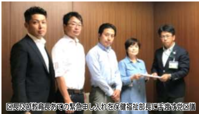
区長及び教育長あての緊急申し入れを保健福祉部長に手渡す党区議

8月8日、党区議団は区長・教育長に対し、熱中症対策の推進を求め、緊急の申し入れを実施しました。 対応した保健福祉部長は、緊急対策の必要性を認め、要望の内容について検討すると答弁しました。