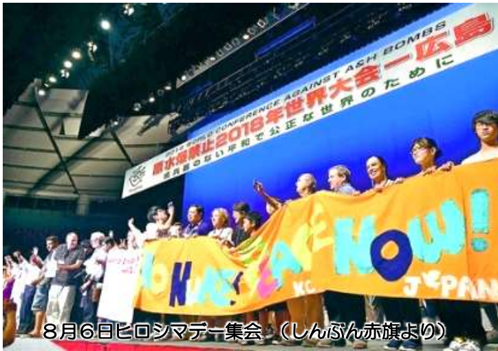
8月6日ヒロシマデー集会