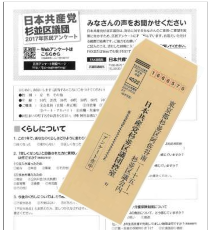
アンケート用紙と返信用封筒。切手を貼らずに投函してください。