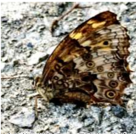
全体的に茶色系で一見地味ですが、翅の模様はとてもきれいです。

いそつです。彼らに出会えるということは杉並にも屋敷林などの森林が残っている証拠。今後も彼らが住むことができる環境を、杉並に残していきたいですね。