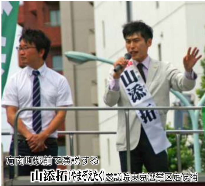
方南町駅前演説する 山添拓(やまぞとたく) 参議院東京選挙区定候補