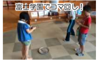
富士学園でコマ回し！

原発政策推進や復興のために原発事故の被害を小さく見せようとする行政側の姿勢が、子ども達の健康を犠牲にし、我が子の成長を願う親の気持ちを切り捨てています