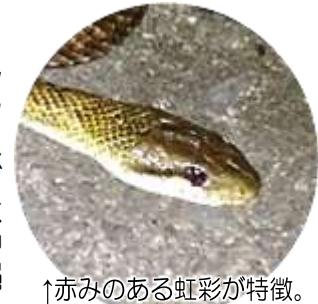
↑赤みのある虹彩が特徴。

シマヘビは沖繩を除く日本全国で見られ、アオダイショウと並んで身近なヘビです。日本にしか生息しない固有種で毒は持ちませんが、鼠や小鳥、爬虫類や両生類などを捕食しますが、なかでもカエルが好物なように水辺環境がのこる緑地で見られます。東京都の第4