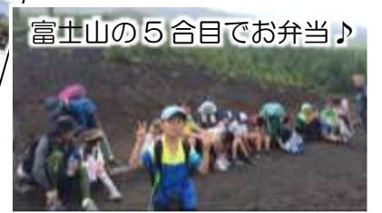
富士山の5合目でお弁当♪