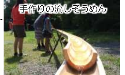
手作りの流しそうめん