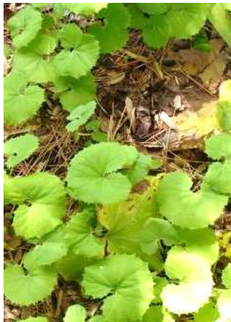
↑群生しているフキの葉。

道の地では何処にでも生えていてとても身近な植物でしたが、宅地化が進んだ杉並では意識して探さない見つかる事ができません。きれいに整備された公園のみどりも大切ですが、公園の端で小さくとも力強く芽を出す、そんな緑を大切にしていきたいですね。