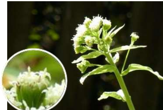
↑先端の拡大図。小花が集まって頭花に。

道の地では何処にでも生えていてとても身近な植物でしたが、宅地化が進んだ杉並では意識して探さない見つかる事ができません。きれいに整備された公園のみどりも大切ですが、公園の端で小さくとも力強く芽を出す、そんな緑を大切にしていきたいですね。