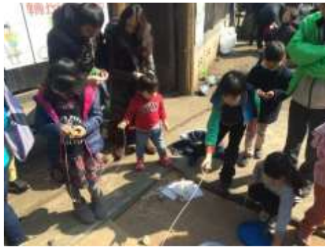
←たくさんの子ども達とコマ回し。