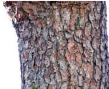
↑迫力のある鱗状の樹皮。

や盆栽に使われます。杉並区内でもアカマツが植えられた庭をよく見ますが、これほど立派な枝ぶりの個体は珍しいのではないのでしょうか。うろこ状にひび割れ