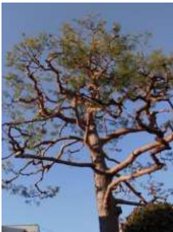
↑空を仰ぐアカマツ。

杉並区であってほしいです。赤みを帯びた樹皮も見ごたえが十分あります。持ち主の方にお話を聞くと、戦後すぐに杉並に来た時から生えていたとか。手入れが大変なんですと苦笑いされていました。こういう巨木がいつまでも大切にされる