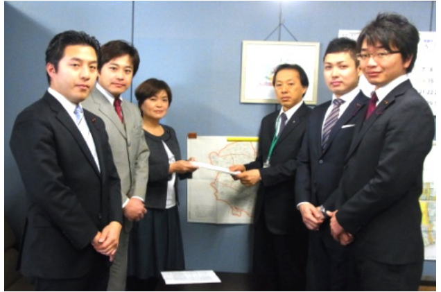
↑区長あての申し入れ書を政策経営部長(右から3番目)に手渡す区議団。