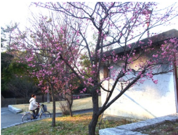
↑たくさんの蕾が大きく膨らみ、少しずつ八重咲きの花が開いていました。