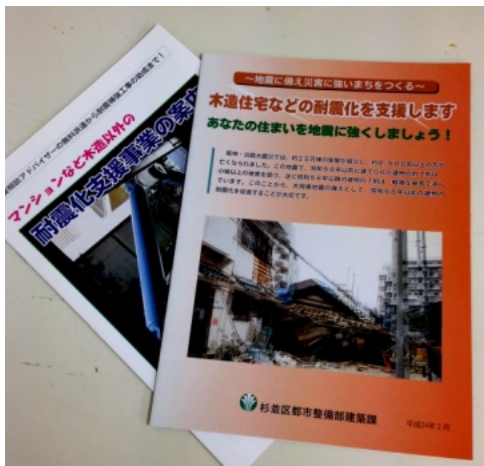
↑耐震診断のパンフレット

阪神・淡路大震災の際は、倒壊した建物から出火し、まち全体への延焼につながりました。首都直下型の大地震が発生した場合、同時多発的な火災が起これると予想され、全ての出火場所に消防車がたどり着く事が出来ないと消防署職員が告発しています。地域の防災力を高めるためにも、倒れない、そして出火させない対策が急務です。