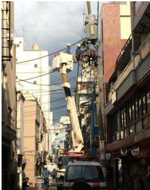
↑高円寺南4丁目の復旧作業の様子

したことによるもので、阿佐谷地域の民間ビルの配電盤の故障が1カ所、高円寺南地域では電柱に設置された電流分岐装置の故障が2カ所と計3カ所の故障が重なりました。