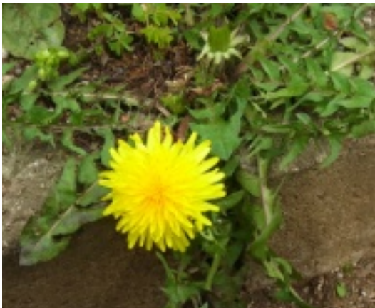
↑花壇の端で黄色い花を咲かせていました

花の付け根の総苞片（そうぼうへん）と呼ばれる部分が上向きに伸びているのが在来種、反り返っているのが外来種です。こんどタンポポを見かけたら在来種かどうか確認してみてくださいね。 在来種のタンポポも見た目は同じ黄色い花ですが、花の付け根の総苞片（そうぼうへん）と呼ばれる部分が上向きに伸びているのが在来種、反り返っているのが外来種です。こんどタンポポを見かけたら在来種かどうか確認してみてくださいね。