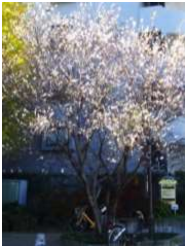
↑三分の一の花が開花中。

エドヒガン桜の系列でコヒガン桜の園芸種で盆栽や庭木などに利用されています。 今回、出会った十月桜は花弁が多く、花一つ一つは小さいもののじっくり見るとポリリウム感たっぷりです。残りの三分の二が咲く春が楽しみです。