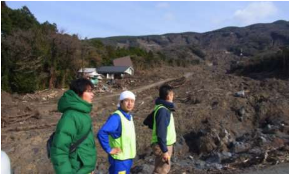
[写真上]休憩の時間に土砂災害の現場を視察。山肌が崩れた跡が生々しく残り、道路のアスファルト以外は全て流されていました。 [写真右上]頭の高さまで土砂が流れてきた痕跡が民家に残っています。 [写真右下]土砂災害を受けた古民家。多額の費用が掛かるため、修復するかどうか、まだ決めかねているそうです。