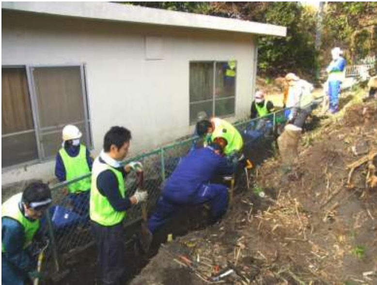
↑泥出し作業に参加。汗だくになりながら作業しました。